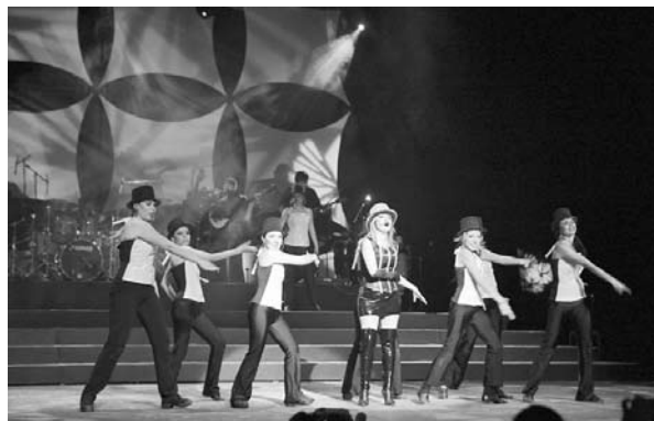
■ El espectáculo musical de la Universidad Autónoma de Tamaulipas.