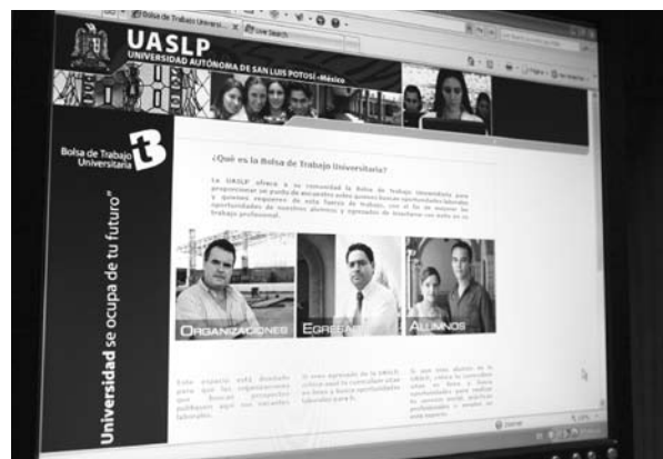
■ Portal universitario de la Bolsa de Trabajo de la UASLP. http://bolsatrabajo.uaslp.mx

A efecto de reforzar la difusión, se publicaron artículos en la Revista de la Asociación Potosina de Ejecutivos de Relaciones Industriales, A.C. y en el Boletín Electrónico de la Red de Vinculación de la Región Noreste de la Asociación Nacional de Universidades e Instituciones de Educación Superior.