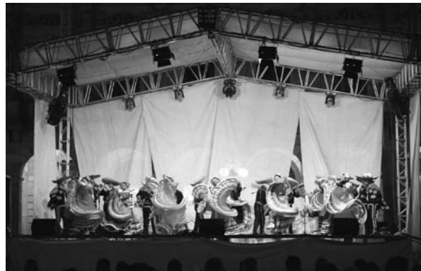
■ El ballet folclórico de la UASLP en el Festival universitario del 10 de enero.

Los estudiantes, trabajadores administrativos y docentes universitarios cada vez más se incorporan a grupos y talleres del Departamento de Arte y Cultura, con el que está vinculado el Departamento de Proyectos Especiales.