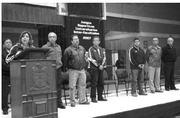
■ Inauguración de los Juegos deportivos universitarios interfacultades.

En este periodo se seleccionó a la mascota universitaria Xanti para fortalecer la identidad deportiva universitaria y se fundó la Escuela de Tae Kwon Do de la UASLP, cuyo propósito es propiciar que mayor número de alumnos practiquen esta disciplina.