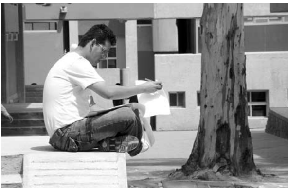
■ Cualquier sitio del campus es cómodo para estudiar.

Los miembros del comité presentaron ante las autoridades universitarias propuestas sobre temas como: Perfil competitivo, Programa de educación basada en los talentos, Desarrollo de habilidades de emprendedores, Desarrollo integral del estudiante universitario, Foros de intercambio de opinión de cámaras y asociaciones empresariales-alumnos, Organización de incubadoras de empresas para jóvenes universitarios y Valor agregado a la educación universitaria. Entre los asuntos presentados a los miembros del Comité Asesor Externo por directores