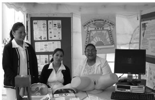
■ Personal de la Facultad de Enfermería asesorando a alumnos durante la Semana de salud.

El Programa Institucional de Promoción de la Salud (PIPS) impulsa la cultura de responsabilidad individual y social