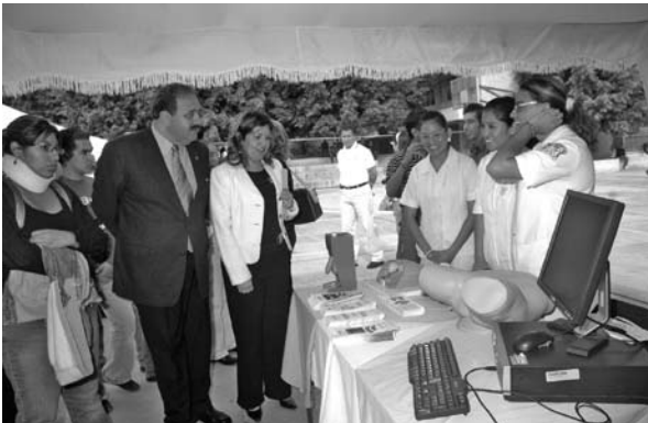
■ Autoridades universitarias inauguran el Foro de salud.

Personal de esta dependencia, en coordinación con el Centro de Integración Juvenil, promovió cursos y pláticas de sensibilización contra las adicciones en las facultades de Derecho y Hábitat y en la organización de la Clínica para dejar de fumar y bebedores problema.