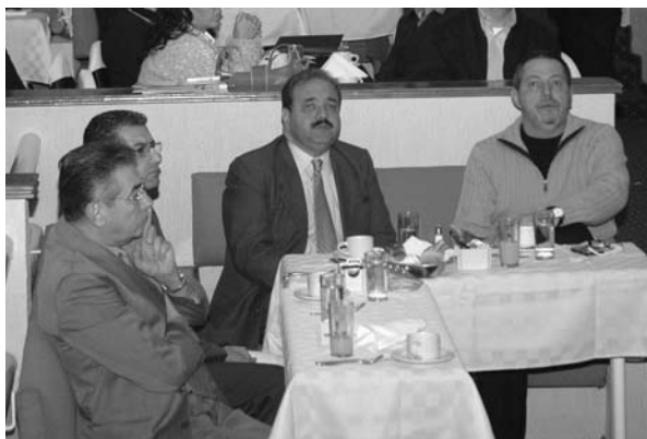
■ Reunión de empresarios con autoridades universitarias.

Presentó los programas universitarios de apoyo al sector empresarial, con la colaboración de los coordinadores de vinculación de las entidades académicas; fueron invitados empresarios de la Cámara Nacional de la Industria de Transformación, Cámara Nacional de Comercio, Industriales Potosinos, A.C., Confederación Patronal de la República Mexicana y Cámara Nacional de la Industria de la Construcción. El objeto fue dar a conocer de manera resumida los servicios y potencialidades de vinculación que la universidad ofrece a las empresas. Fueron 17 exposiciones y participaron 160 personas.