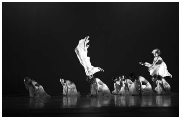
■ Unidanza en una de sus presentaciones de Jueves en movimiento.