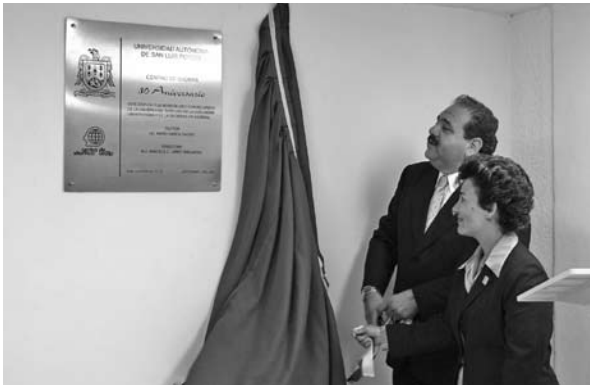
■ Develación de la placa del nuevo Centro de Idiomas Infantil.

mil 489; se incrementó el número de usuarios en los cursos de francés e italiano. El Centro de Idiomas Adultos tuvo una población anual de 10 mil 578 alumnos. Para tal efecto, se ha contado con el apoyo de la Facultad de Derecho, con la prestación de aulas para la impartición de los cursos. La extensión Matehuala incrementó su población a 850 estudiantes y la extensión ubicada en el municipio de Rioverde creció a 200.