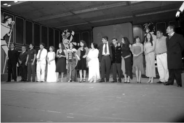
■ Ganadores del concurso de canto Nuevos Valores Artísticos Universitarios.

ra y las Artes y con el apoyo de la Escuela de Ciencias de la Comunicación, ofreció los Diplomados en promoción y gestión cultural I y II. Se inició una extensión en la Unidad Académica Multidisciplinaria Zona Huasteca.