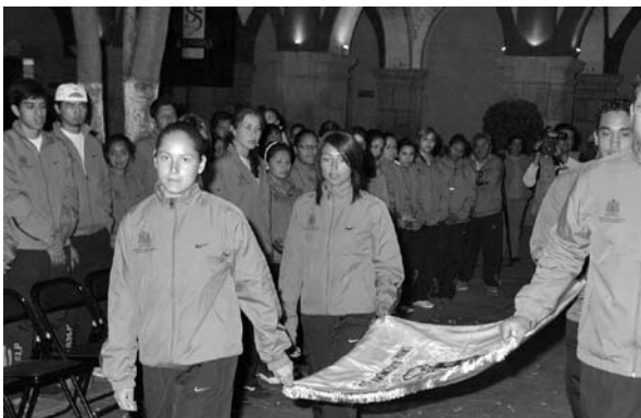
■ Abanderamiento de la Delegación Deportiva Universitaria.

Participan las instituciones que obtuvieron los dos primeros lugares en los Juegos estatales de Aguascalientes, Guanajuato, Querétaro y San Luis Potosí, que corresponden a la Región V del Consejo Nacional del Deporte de la Educación A.C. (Condde);