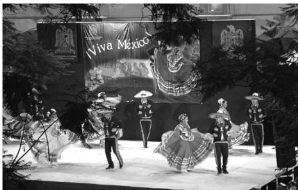
■ 40 años de folclore en la Universidad Autónoma de San Luis Potosí.

bajadores Ferrocarrileros de la República Mexicana y Servicio Postal Mexicano.