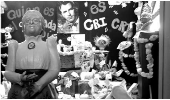
■ Figuras en pasta, elaboradas por alumnos de Arte y Cultura.