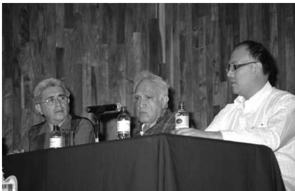
■ Carlos Monsiváis dictó una conferencia a los jóvenes universitarios.