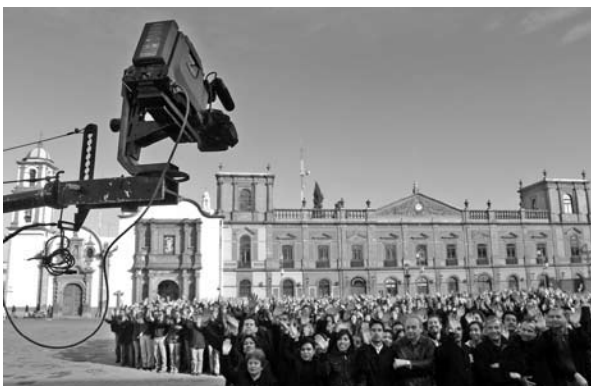
■ Integrantes de la UASLP se reunieron frente al Edificio Central para la foto conmemorativa del 85 aniversario de la autonomía.

El trabajo que desarrolla el Departamento de Televisión Universitaria es relevante en la División de Difusión Cultural y en toda la UASLP, ya que a través de sus diferentes