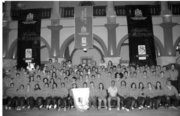
■ Más de cien alumnos integran la Delegación Deportiva de la UASLP

fueron organizados por la Universidad Autónoma de Aguascalientes.