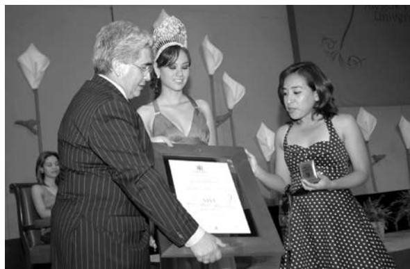
■ La universidad premió a los ganadores de la edición XLVI de los Juegos florales.