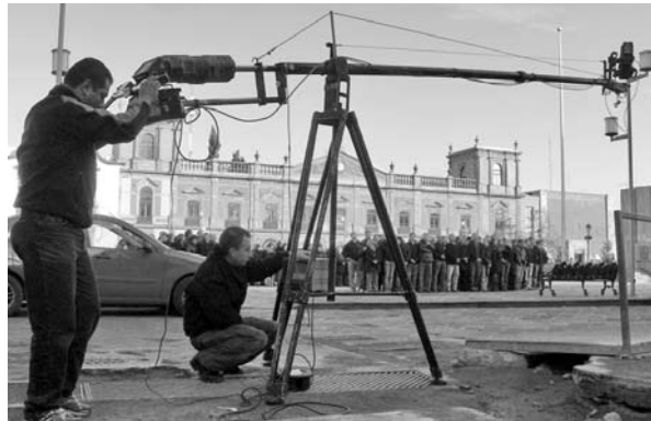
■ Personal de TV Universitaria en la grabación de la foto conmemorativa del 85 aniversario de la autonomía.

acciones manifiesta a la población quiénes son los universitarios y qué es lo que hacen.