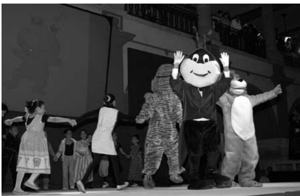
■ Concierto homenaje a Francisco Gabilondo Soler, Cri Cri .