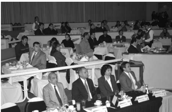
■ Empresarios y directivos universitarios durante una reunión para informar sobre los servicios que ofrece esta casa de estudios.