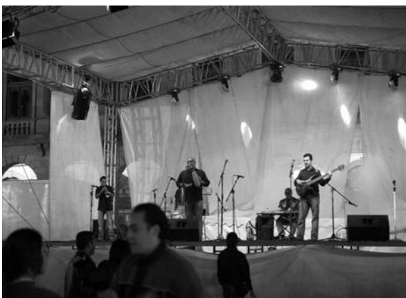
■ Sabor-Son, de La Habana, Cuba, durante el Festival del 85 aniversario de la autonomía.

Se ha mantenido la premisa de presentar lo mejor en exposiciones de pintura y fotografía y los autores han donado al menos una de sus obras para que siga creciendo la pinacoteca universitaria. Vale la pena destacar que se presentó con gran éxito la exposición pictórica del destacado luchador Mil Máscaras; durante el tiempo que duró esta muestra se registró un fenómeno inusitado en una actividad similar, ya que asistieron ocho mil personas.