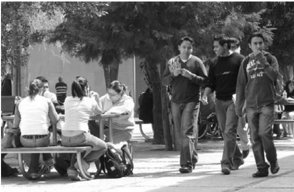
■ Alumnos universitarios en las áreas de descanso de la Zona Universitaria Poniente.

el Modelo de Formación Integral de la UASLP, sometido a la consideración de la ANUIES, dentro de su Programa de Apoyo a la Formación Profesional 2007.