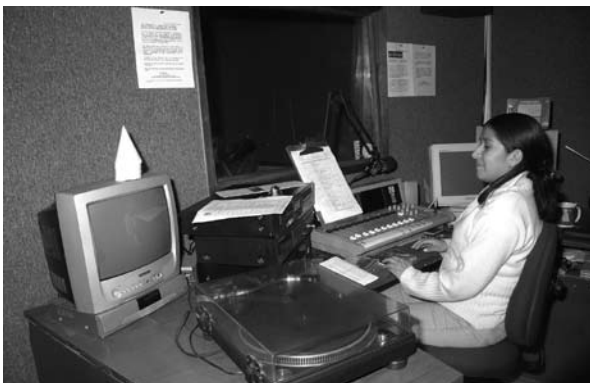
■ Al cumplir 70 años, Radio Universidad estrenó equipo e instalaciones.