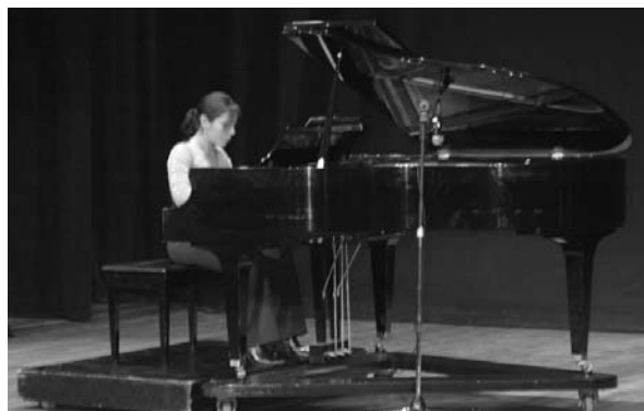
■ Alumna de piano del Departamento de Arte y Cultura.

Una actividad importante del departamento es la organización y presentación del concurso de canto nuevos valores artísticos universitarios, que llegó a su XIII edición y que recibe cada vez más un mayor número de participantes. Por segundo año consecutivo se abrió el concurso a estudiantes de escuelas preparatorias incorporadas a la universidad.