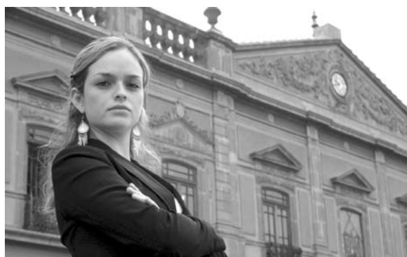
■ Visita el portal de egresados de la UASLP.

En referencia a la administración del portal de egresados http://www.exauaslp.mx se atendieron mil 30 peticiones de exalumnos que se han registrado en ese portal; también 355 peticiones de los que pidieron sus claves para hacer uso del servicio. Entre las actividades de difusión del portal, permanentemente se invita a los egresados a realizar su registro para que accedan a información sobre cursos, talleres y actividades de las escuelas y facultades para ellos, e información del acontecer universitario, lo que propicia una comunicación constante entre alumnos y la universidad. Otro de los beneficios que se da a los usuarios es la asignación de una cuenta de correo electrónico con el dominio @exauaslp.mx , que lo identifica como egresado. En cuanto a la base de datos, aumentó en 50 por ciento; cuenta con 43 mil 798 registros.