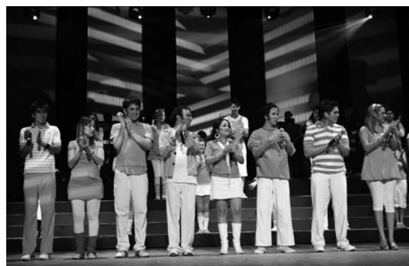
■ El espectáculo Once de la Universidad Autónoma de Tamaulipas durante los festejos del 85 aniversario de autonomía.

La División de Difusión Cultural en coordinación con la Secretaría de Cultura y el Consejo Nacional para la Cultu-