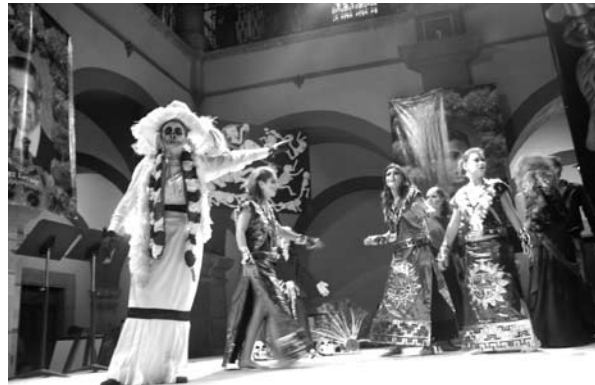
■ La puesta en escena La Catrina en el mes de noviembre.

Con el propósito de complementar los talleres, periódicamente se realizan viajes de estudio. En el lapso que nos ocupa se realizaron los siguientes: