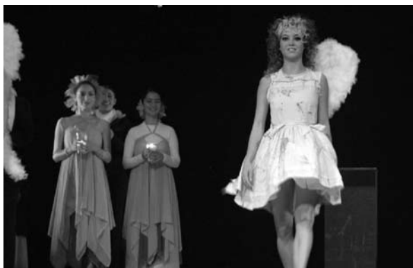
■ La vendedora de fósforos, obra de teatro que se presentó en los festejos decembrinos.

Otra función de este departamento es atender las solicitudes para el alquiler del Paraninfo Universitario Rafael Nieto, recinto que ha sido escenario de los acontecimientos culturales y artísticos de esta casa de estudios y de muchos ajenos a la institución; en este periodo se atendieron 300 servicios.