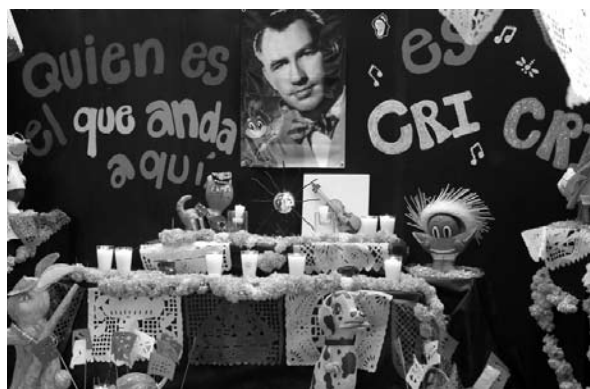
■ Altar de muertos en honor a Francisco Gabilondo Soler, Cri Cri .