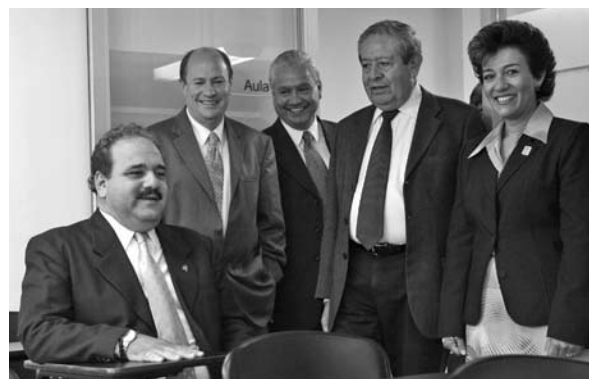
■ Las nuevas instalaciones del Centro de Idiomas Infantil.

El diseño del sitio web y su reestructuración están en proceso para contar con un dominio DNS propio y poder integrar elementos como animaciones, formulario de consulta de datos, almacenar los servicios, cursos, y otros contenidos del Centro como ya existe en otras dependencias de la universidad.