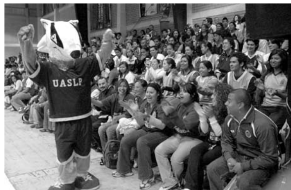
■ La mascota universitaria en ambiente con los estudiantes universitarios.

Como es tradición se realizó la edición XXVI del Campamento infantil universitario. Este año registró una asistencia de 700 niños.