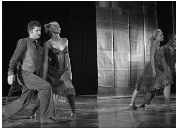
■ Integrantes del ballet Pec's del Teatro Nacional de Hungría.

Continúa el convenio con la Secretaría de Cultura del Gobierno del Estado que ha permitido a los grupos artísticos presentarse en las diferentes regiones de San Luis Potosí, y al Cine Club llegar a ciudades y poblados que carecen de salas cinematográficas; gracias a esto un importante sector de la población disfrutará de espectáculos de calidad sin costo alguno. Asimismo mediante este convenio se ha grabado y presentado el CD del grupo de música latinoamericana Axtla y el DVD El Arribeño, último redoblado de un huapango .