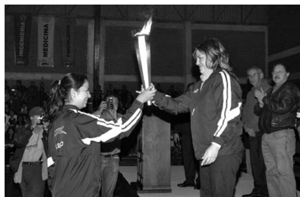
■ Autoridades universitarias entregaron el fuego olímpico a la alumna que representó a la comunidad estudiantil.