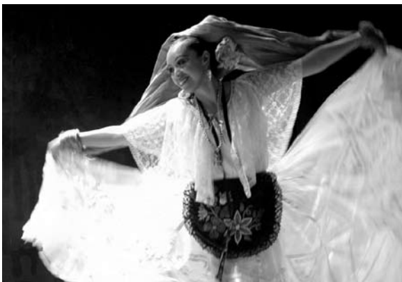
Grupo de Danza Folclórica del Departamento de Arte y Cultura.

El Radio Maratón Universitario se asignó a una de las funciones sustantivas de la universidad que es la difusión de la cultura. La División de Difusión Cultural realizó una serie de actividades que lograron darle una característica particular a esta colecta anual; la cantidad recaudada fue de un millón 800 mil pesos.