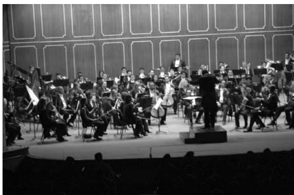
Concierto Body Notes.

Durante este periodo se concluyó la serie de divulgación Premios universitarios seis documentales, y de la