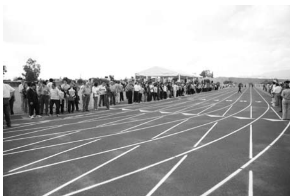
Reinauguración de la pista de tartán para atletismo en la Unidad Deportiva Universitaria.