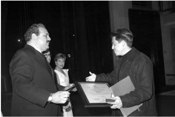
Premiación de los XLV Juegos florales universitarios.

Radio Universidad recibió la visita de escuelas de pre-escolar y primaria, se les dio una explicación de lo que realiza una radio universitaria, a más de 500 niños. En la barra programática existe un espacio dedicado a los niños, de ahí que se estén realizando estas visitas periódicas a la estación.