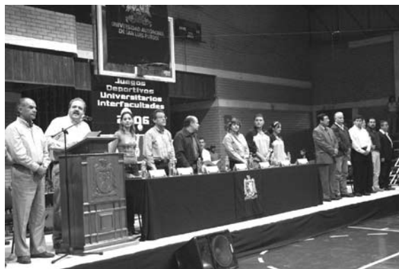
Inauguración de los Juegos interfacultades 2006.