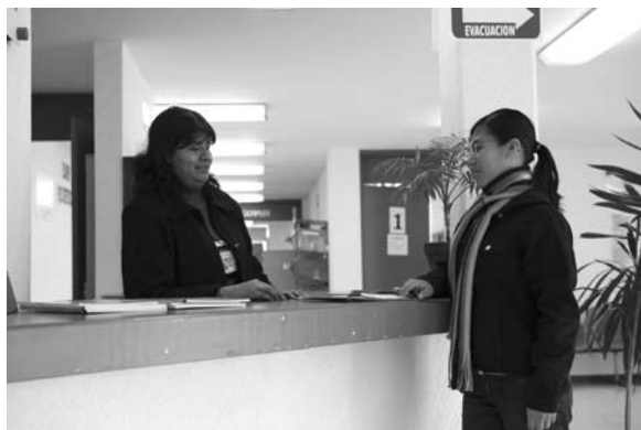
Recepción del Centro de Salud Universitario.

El Centro de Salud Universitario aplicó los exámenes de análisis clínicos a personal de radiología de la Facultad de Estomatología. Apoyó con módulos de servicio médico en el Medio maratón deportivo universitario y Carrera de 10 km; en la carrera de relevos de la Facultad de Ingeniería; en la convivencia atlética de la Facultad de Psicología, realizada en las instalaciones de la Unidad Deportiva Universitaria y en el Congreso Internacional de Educación Física de la Facultad de Ingeniería.