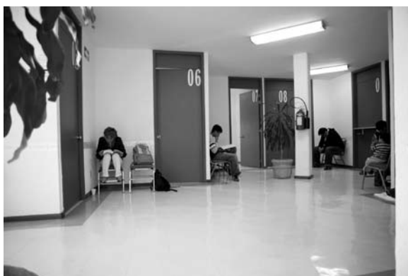
Sala de espera del Centro de Salud Universitario.