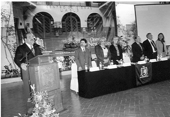
2º Congreso internacional de la enseñanza de lenguas y culturas extranjeras Opening new doors .

término de estos niveles, que se cursan en dos años, los alumnos pueden elegir entre los programas de preparación para el First certificate in english (FCE) , Test of english as a foreign language (TOEFL) , Curso de fonética, Curso de comprensión y traducción de textos, Seminario de formación de profesores I y II y el Diplomado en la enseñanza del inglés como segundo idioma.