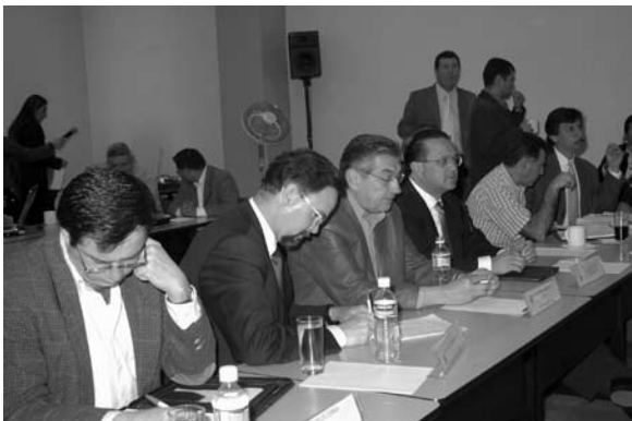
Seminario de capacitación a pequeñas y medianas empresas.

las conferencias: Prácticas responsables, Regulación sanitaria y protección civil e Instituciones de apoyo para las organizaciones de la sociedad civil.