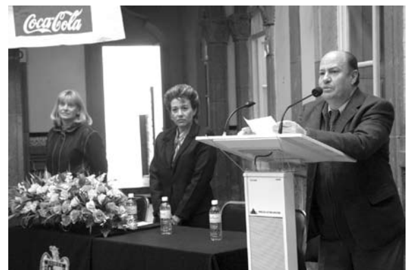
2º Encuentro nacional del idioma ruso.

El DUI hizo una importante donación de materiales para incrementar el acervo existente en el Centro de Autoacceso (SAC). Recientemente, la Biblioteca Pública Universitaria cedió una colección de cuentos en francés. Se recibieron donaciones de mesabancos y se adquirió el equipo necesario para acondicionar la sala de karaoke.