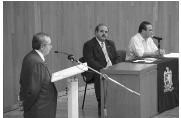
Reunión del Comité Asesor Externo de la UASLP.

Un total de 4 mil 647 estudiantes y pasantes participó en actividades de servicio social. Se asignaron en calidad de prestadores 2 mil 554 y cumplieron con esta responsabilidad 2 mil 93 jóvenes. Es importante señalar que los alumnos de la Coordinación de Ciencias Sociales y Humanidades se han incorporado a esta actividad académica. Lo anterior representa, por derechos de gestión administrativa, un ingreso estimado en recursos para la institución de 464 mil 700 pesos aproximadamente.