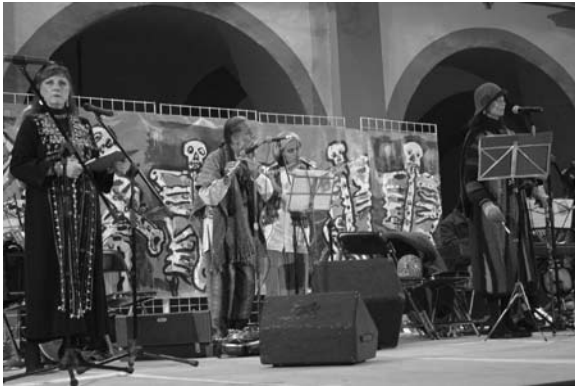
Concierto Cala Calaca con Mitote Jazz.

trativas. En el acto inaugural actuó del grupo Ce-acatl. En coordinación con la Dirección de Festivales Internacionales de la Secretaría de Cultura del Gobierno del Estado apoyó la presentación del concierto del grupo La Giralda de Música Barroca, efectuado en el patio del Edificio Central.