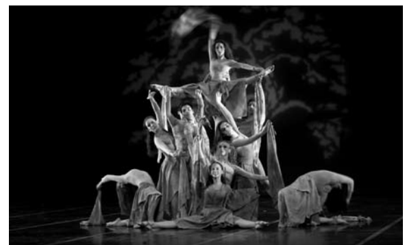
El grupo Unidanza, en Jueves en Movimiento .

Con el apoyo del Consejo Nacional para la Cultura y las Artes se presentó un homenaje al maestro Mario Ruiz Armengol, con la actuación y presentación del trabajo