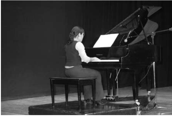
Fin de cursos del Departamento de Arte y Cultura.

15°. Concurso de estampilla postal Navidad Mexicana, convocado por el Servicio Postal Mexicano. También logró el tercer lugar en el concurso de cultura turística infantil México limpio y querido que organizó la Delegación Estatal de Turismo.