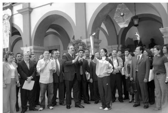
Entrega del fuego universitario de manos del rector a una alumna de la UASLP.

En esta actividad compitieron alumnos deportistas de las instituciones de educación superior del estado de San Luis Potosí que están afiliadas al Consejo Nacional del Deporte de la Educación, A. C. (CONDDE). Le correspondió organizarlos a la UASLP.