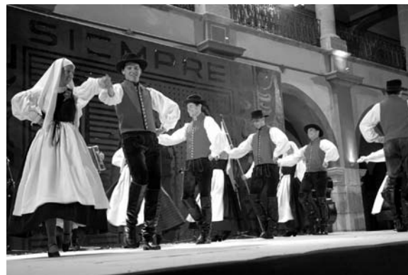
Ballet de Eslovenia.