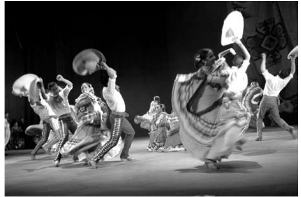
Ballet Folclórico de Colima.