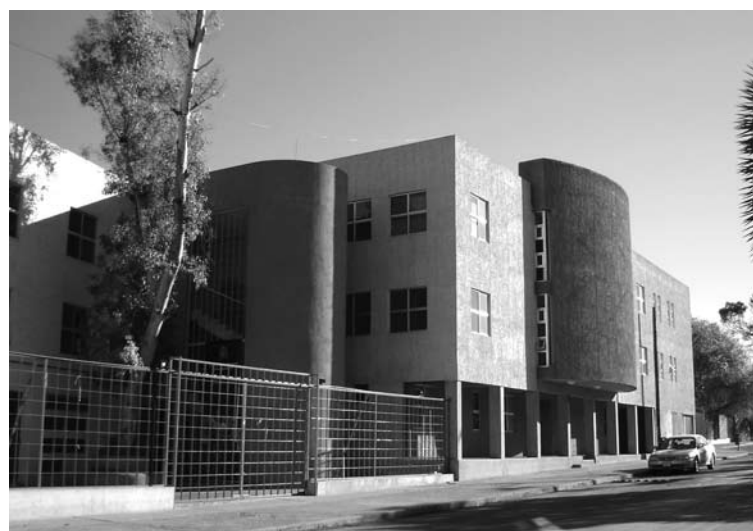
Edificio del Centro Universitario de Apoyo Tecnológico y Empresarial (CUATE)