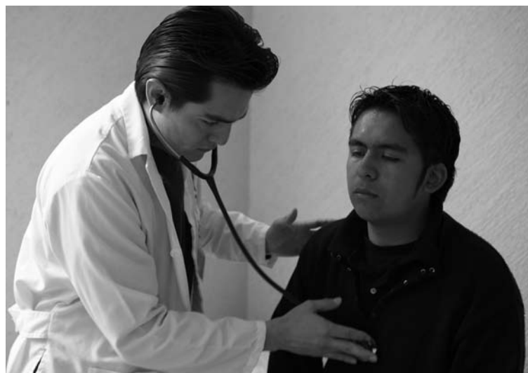
Módulos de atención del Programa Institucional de Promoción de la Salud (PIPS)

Se organizó el 1er. Foro La Salud en el Universitario de Hoy, en el que expertos dictaron conferencias magistrales e instituciones como el Instituto Potosino de la Juventud, Temascal, CONASIDA, MEXFAM, Centros de Integración Juvenil y Centro Estatal Contra las Adicciones instalaron módulos de información. Asistieron 10 mil 500 personas, entre estudiantes, docentes, personal administrativo y público en general.