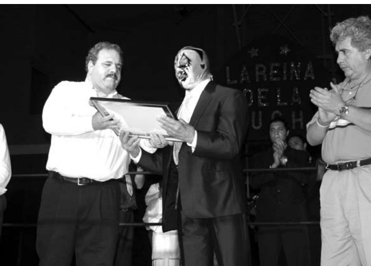
Homenaje al luchador potosino "Mil Máscaras"

El cierre de este proyecto fue de gran relevancia al presentarse en el auditorio de la Unidad Deportiva Universitaria la obra de Teatro "La Reina de la Lucha" escrita por Ignacio Betancourt. En esa ceremonia, en la que estuvo presente el rector de la UASLP, se rindió homenaje al luchador potosino "Mil Máscaras". La obra de Betancourt fue presentada también en el Concurso Estatal de Teatro y en el Centro Penitenciario de Readaptación Social La Pila, donde se rindió homenaje al luchador Blue Demon .