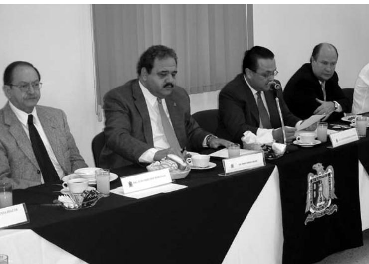
Reunión del CAE

El CUATE realiza, básicamente, actividades de aplicación y, en buena medida, de difusión del conocimiento. Su misión fundamental es establecerse como una ventana de nuestra Universidad hacia su entorno, poniendo en contacto a su personal académico y a sus estudiantes con la sociedad, representada por las organizaciones públicas, privadas y sociales, para construir soluciones creativas y eficaces a los fenómenos que plantea la sociedad actual, empleando y aplicando para ello el conocimiento que se genera dentro de la misma institución.