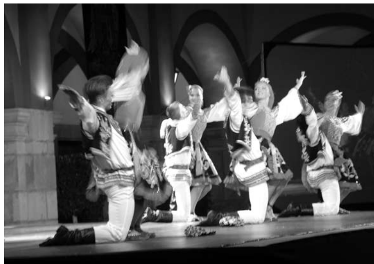
Ballet Souvenir de Rusia

Parte importante de todo programa es su producción, así el departamento de grabaciones realiza 18 programas semanales.