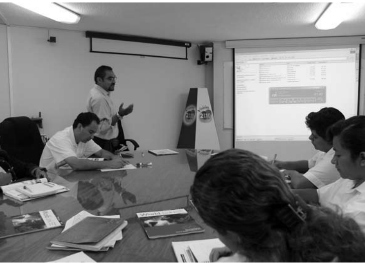
Alumnos del Centro de Idiomas, UASLP

vo de que los alumnos aprendan a comprender e interpretar textos jurídicos escritos en el inglés.