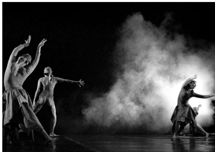
Grupo "Unidanza" de danza contemporánea

Se efectuó la Reunión Nacional de la Red de Televisión Video y Nuevas Tecnologías de la Asociación Nacional de Universidades