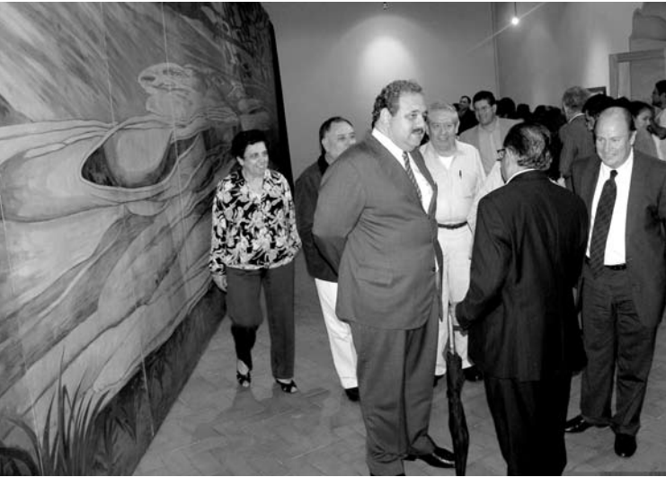
Exposición "Anamorfosis, la Perspectiva Secreta", Centro Cultural Universitario Caja Real.