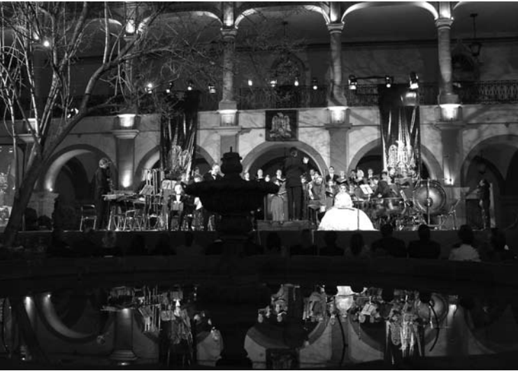
Concierto "Carmina Burana", Patio del Edificio Central de la UASLP

centes y escritores universitarios para que sus obras bibliográficas se den a conocer, se difundan en el ámbito universitario y social.