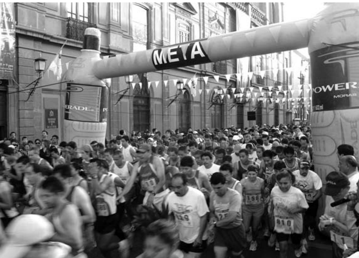
XXIV Medio Maratón Atlético Universitario

La Dirección de Actividades Deportivas y Recreativas coordinó además diversas actividades deportivas al interior de la Universidad, como el torneo Autonomía Universitaria 2005 que tuvo lugar en las canchas de la Zona Universitaria; participaron mil 920 alumnos en fútbol rápido, basquetbol y volibol.