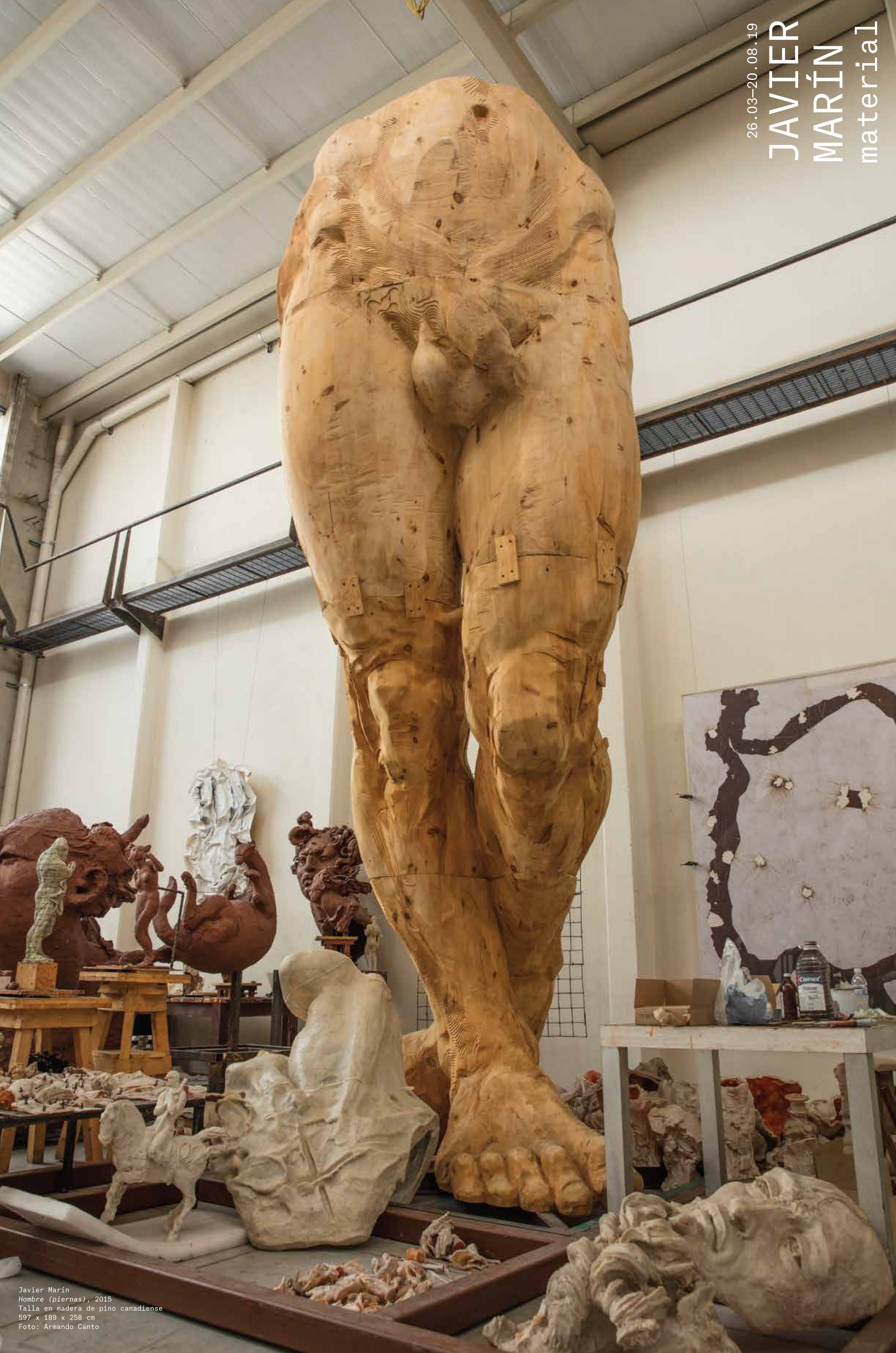
Javier Marín Hombre (piernas) , 2015 Talla en madera de pino canadiense 597 x 189 x 258 cm