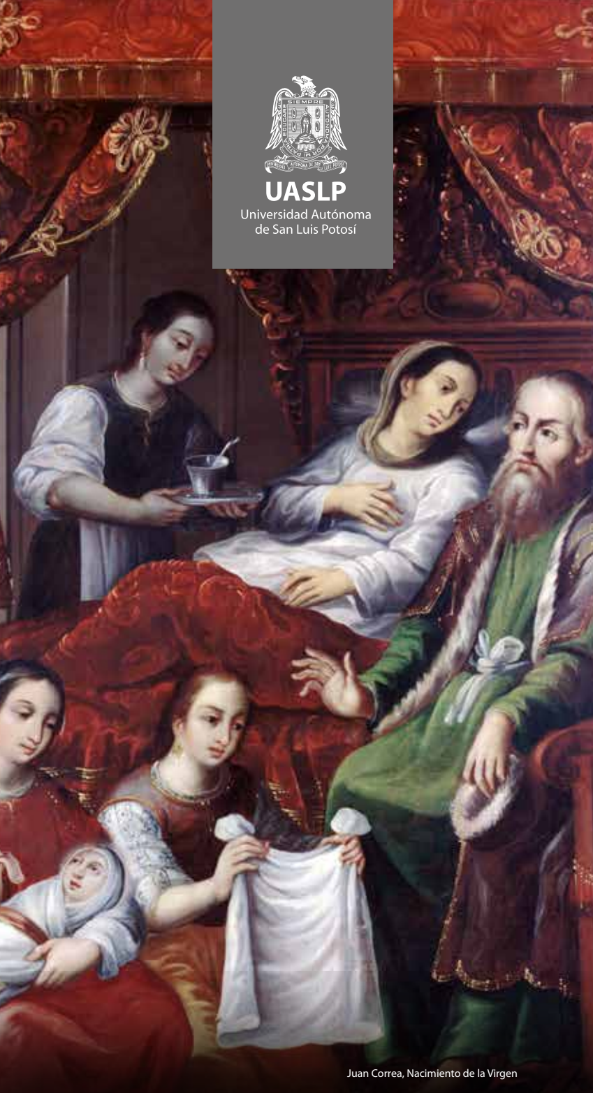
Juan Correa, Nacimiento de la Virgen

UASLP Universidad Autónoma de San Luis Potosí