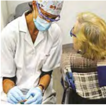
Figura 2. Atención odontológica

disminuir la ansiedad que se produce durante la atención odontológica son de suma importancia, es preciso lograr que el paciente se familiarice con el entorno para evitar el miedo a lo desconocido, por ello la primera cita debe ser en el consultorio, de corta duración y tener siempre una comunicación constante y con términos sencillos.