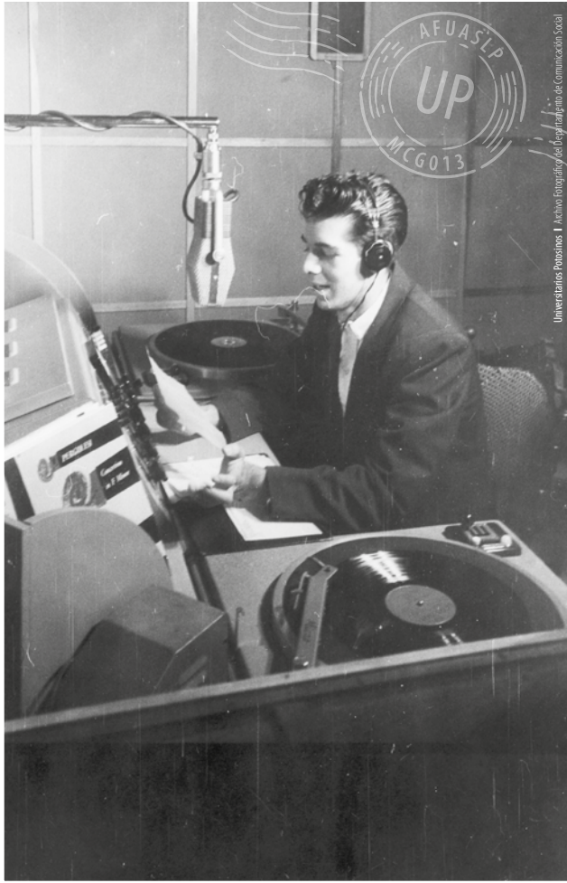
XEXQ Radio Universidad, 1958.