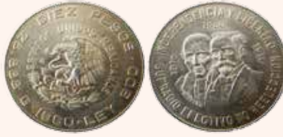
a) Moneda de plata de ley 0.900, sin huellas de golpes.